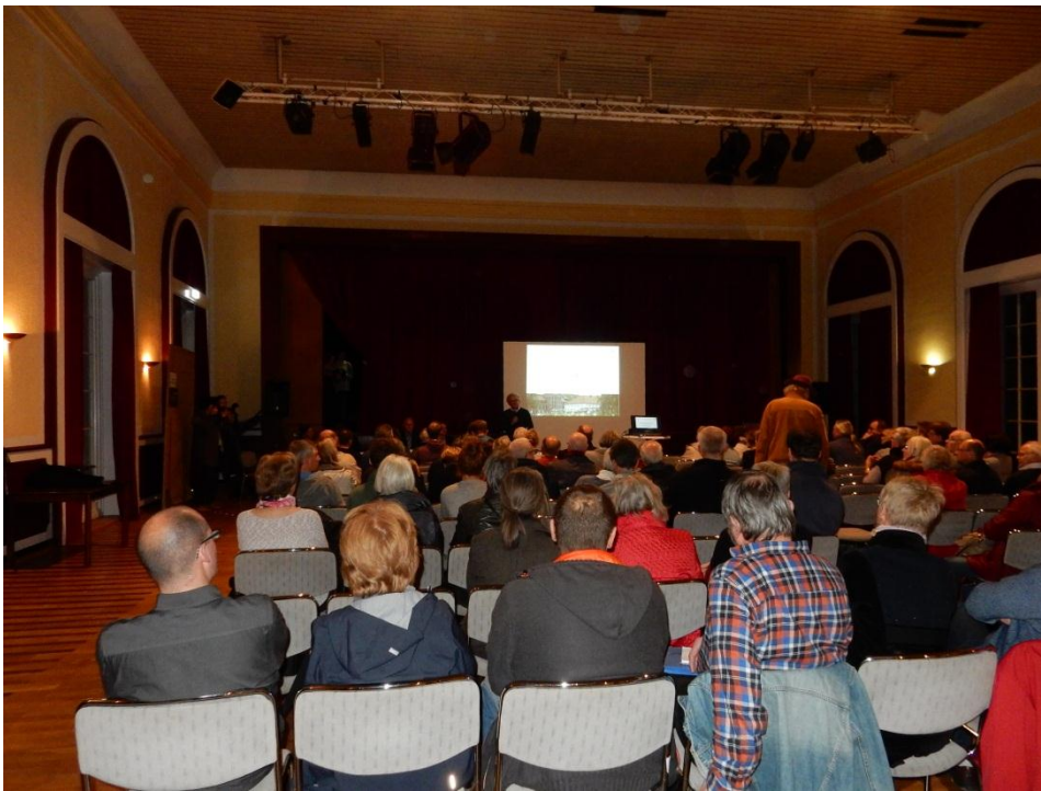
Bürgerforum November 2016 in der Reithalle